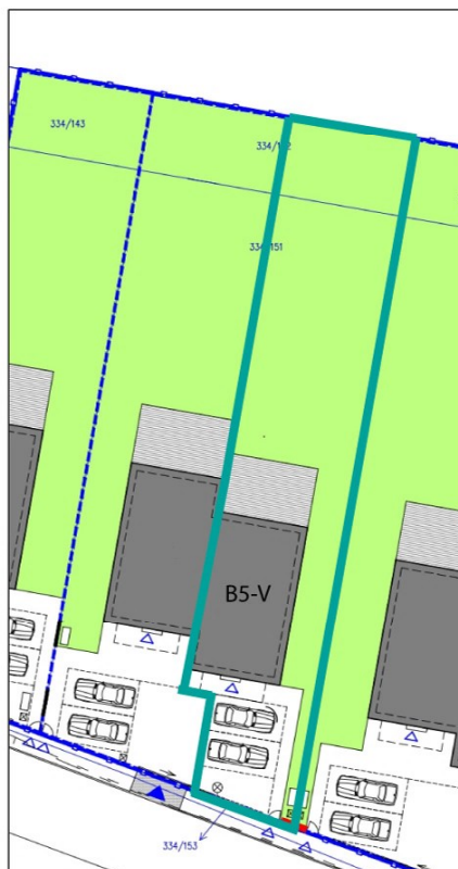
SITUAČNÍ PLÁN POZEMKU: