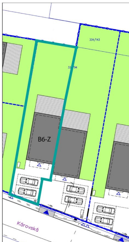
SITUAČNÍ PLÁN POZEMKU: